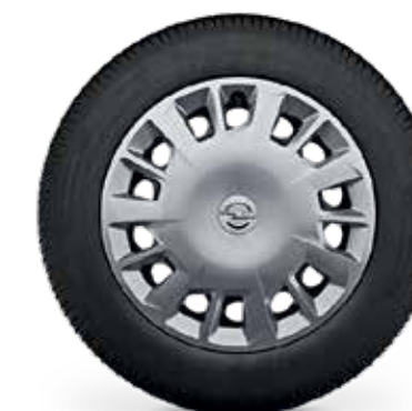
חישוקי פלדה 16" לדגמי EDITION PLUS 5 מושבים