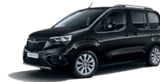
Onyx Black (G7R) שחור מטאלי*