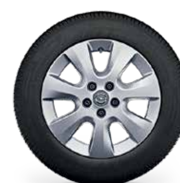
חישוקי סגסוגת 16" לדגמי ELEGANCE PLUS 7 מושבים