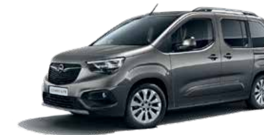
Moonstone Grey (G4O) אפור כהה מטאלי*