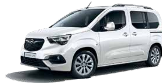
White Jade (G2O) לבן