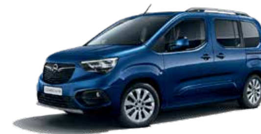
Night Blue (GBT) כחול מטאלי*