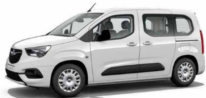
רמת גימור 5 – EDITION PLUS מושבים