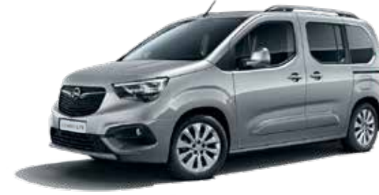
Quartz Grey (G4I) כסף מטאלי*