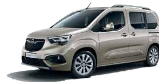
Cool Grey (GAC) בז' מטאלי*