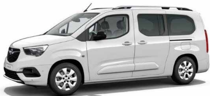
רמת גימור 7 – ELEGANCE PLUS מושבים