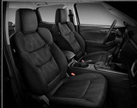
דגם LS+ ריפודי בד בצבע שחור