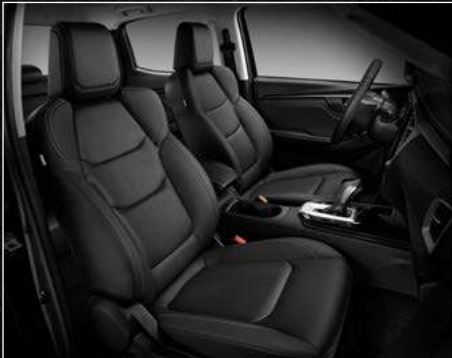
דגמי LS / LSE PREMIUM ריפודי עור בצבע שחור